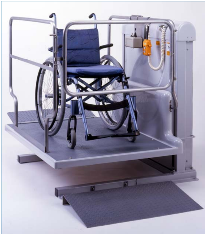
↑写真はKL660(手すりAスイッチ、補助ブリッジはオプション)